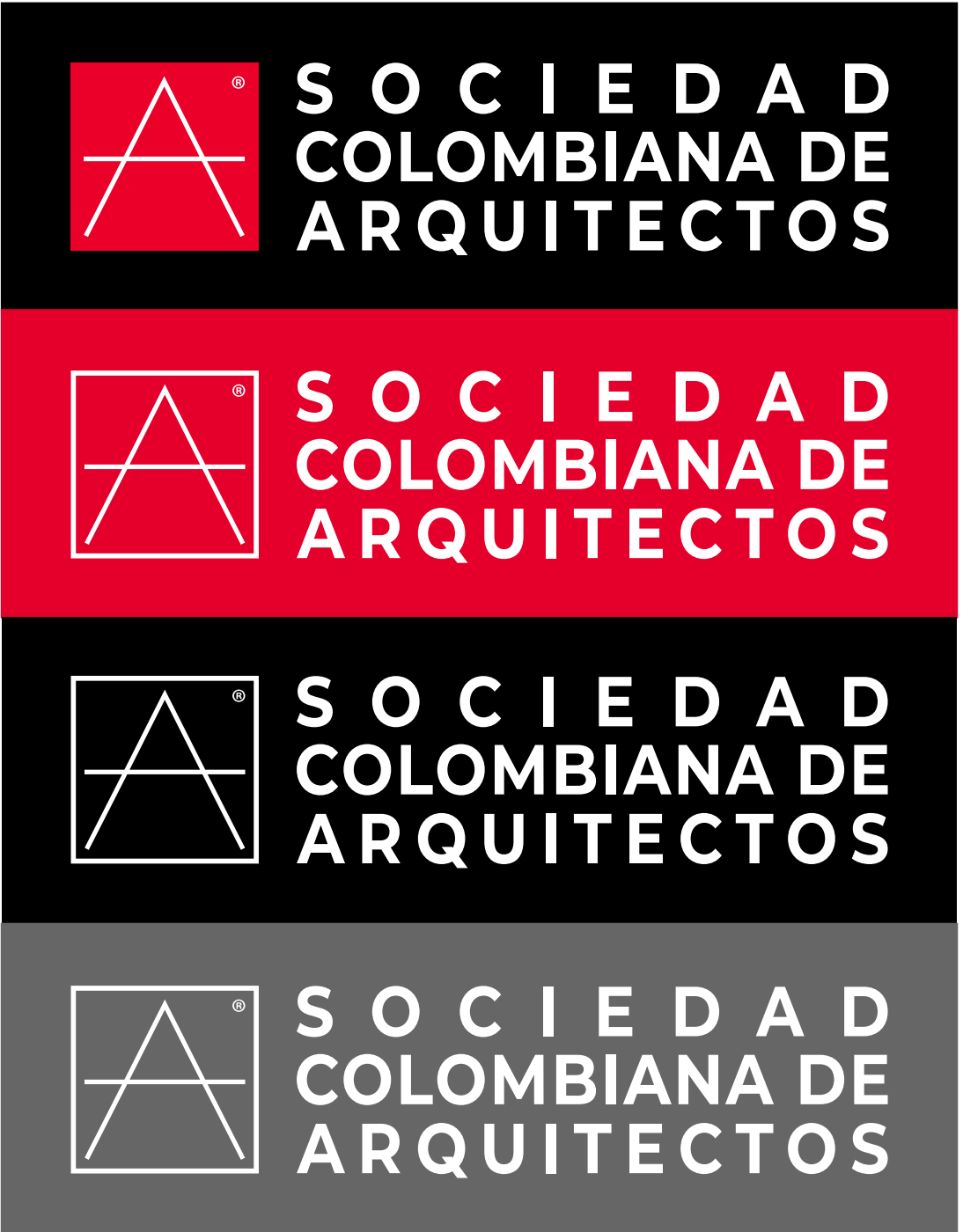
FORMATO HORIZONTAL SOBRE FONDOS PERMITIDOS