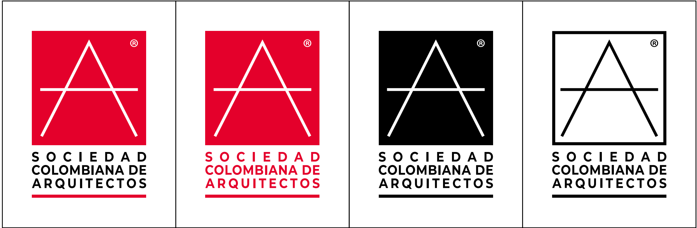
SOBRE FONDOS DE COLOR BLANCO O GRIS CLARO (MÁX. NEGRO AL 40%)