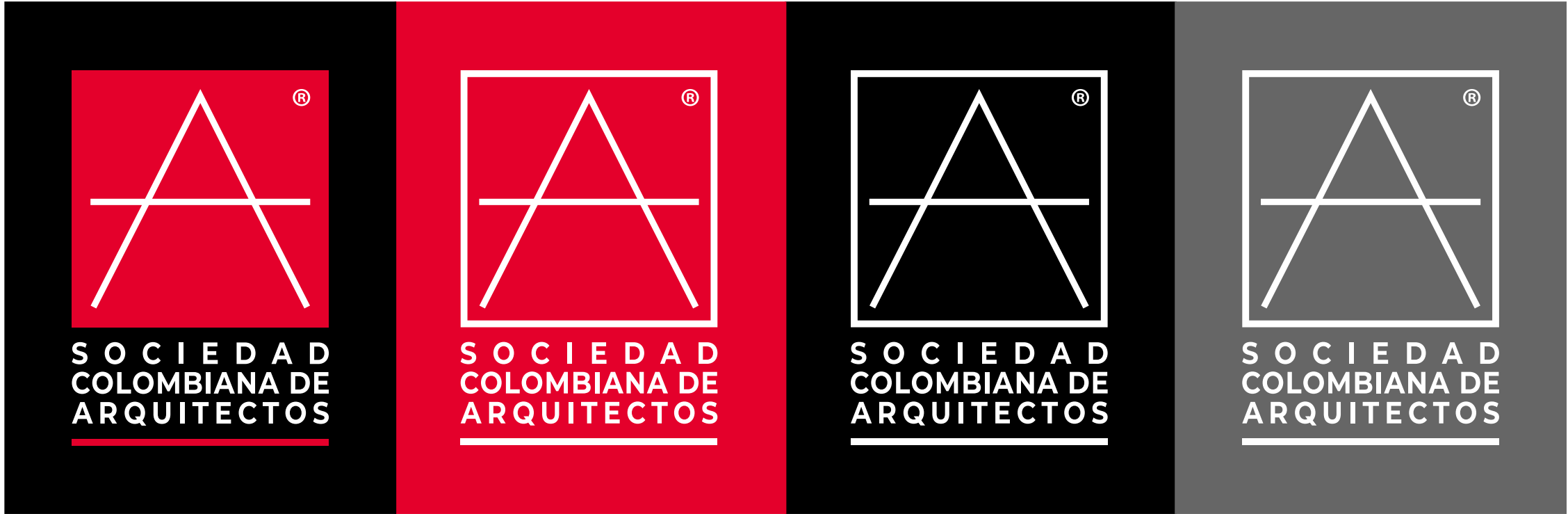
SOBRE FONDOS DE COLOR ROJO, NEGRO O GRIS OSCURO (MÍN. NEGRO AL 50%)