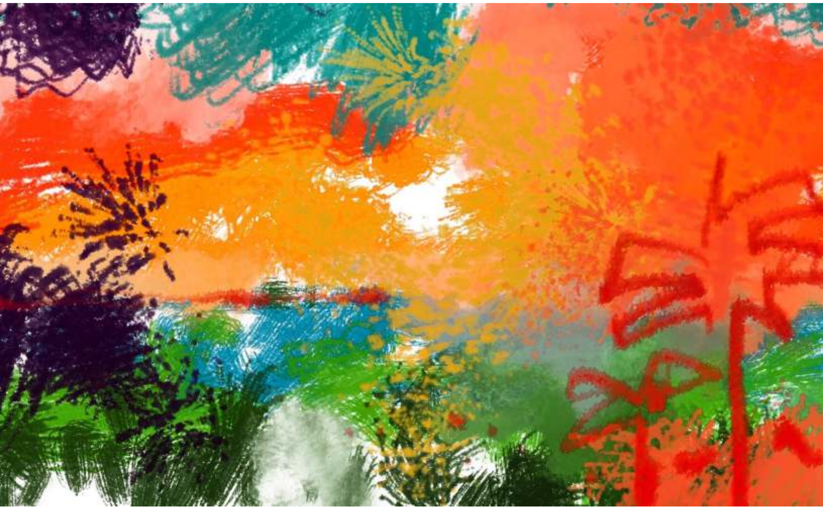
Mauricio Rojas Vera. (2020) Paisaje Tropical.