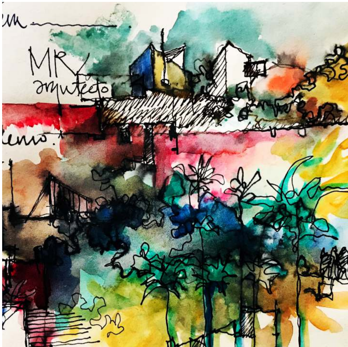
Mauricio Rojas Vera. (2020) Paisajes.